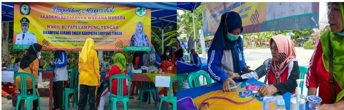
Gambar 2. Pelaksanaan Tes Kesehatan (tekanan darah) sebelum Senam Sehat.

Menurut (Jasmani & Ceria, 2017) Gerakan senam sehat, segar dan ceria adalah gabungan dari gerakan tubuh yang diiringi dengan music. Iringan music ini menurutnya diharapkan dapat menambah motivasi peserta dalam melakukan gerakan yang memiliki power. Hal ini sesuai dengan pelaksanaan senam yang terjadi dilapangan. Alunan music yang mengiringi senam sangat merelaksasi dan membuat seluuh peserta menjadi semangat untuk mengikuti kegiatan senam bersama tersebut. Hal ini didukung oleh pendapat (Tyas & Prasetya, 2022) tentang manfaat senam yang dapat memberikan efek relaksasi, rekreasi dan mampu menurunkan tingkat stres.