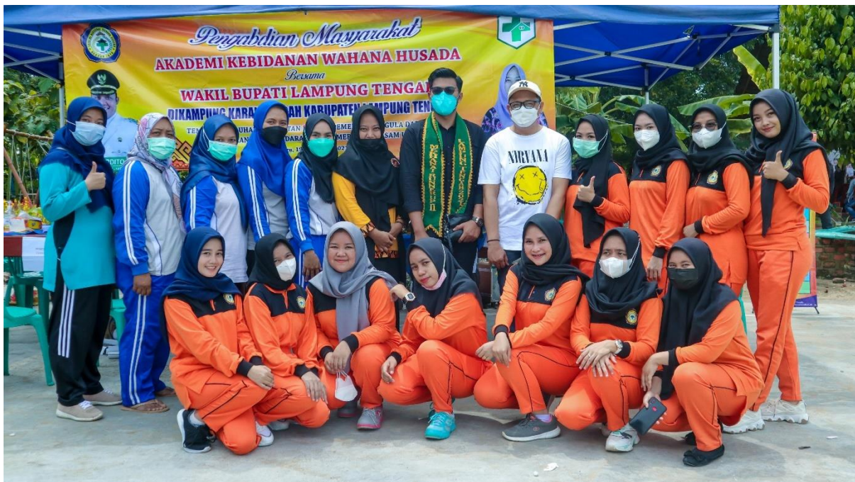
Gambar 5. Pembagian hadiah dan foto bersama dengan panitia pelaksana kegiatan pengabdian kepada masyarakat.

Dalam kegiatan ini, para pelaksana kegiatan mendapati beberapa factor pendukung dan factor penghambat. Factor pendukung dari kegiatan ini diantaranya adalah, semangat dari para panitia kegiatan pengabdian kepada masyarakat khususnya dari team dosen dan mahasiswa, dukungan penuh dari Wakil Bupati Lampung Tengah dan Mengkhanai Lampung Tengah, dukungan dari ketua PAKARE secara langsung yang ikut berkecimpung dalam pelaksanaan kegiatan dan antusias peserta yang begitu semangat dalam mengikuti kegiatan yang dilaksanakan oleh Akademi Kebidanan Wahana Husada Bandar Jaya. Factor penghambat dari kegiatan ini seperti beberapa pengunjung yang tidak berkenan mengikuti senam, dan ada beberapa peserta yang kurang semangat dalam mengikuti senam. Walaupun ada factor pendukung dan penghambat dari berlangsungnya kegiatan ini, secara keseluruhan kegiatan berjalan dengan lancar dan masyarakat mendapat manfaat dari kegiatan ini.