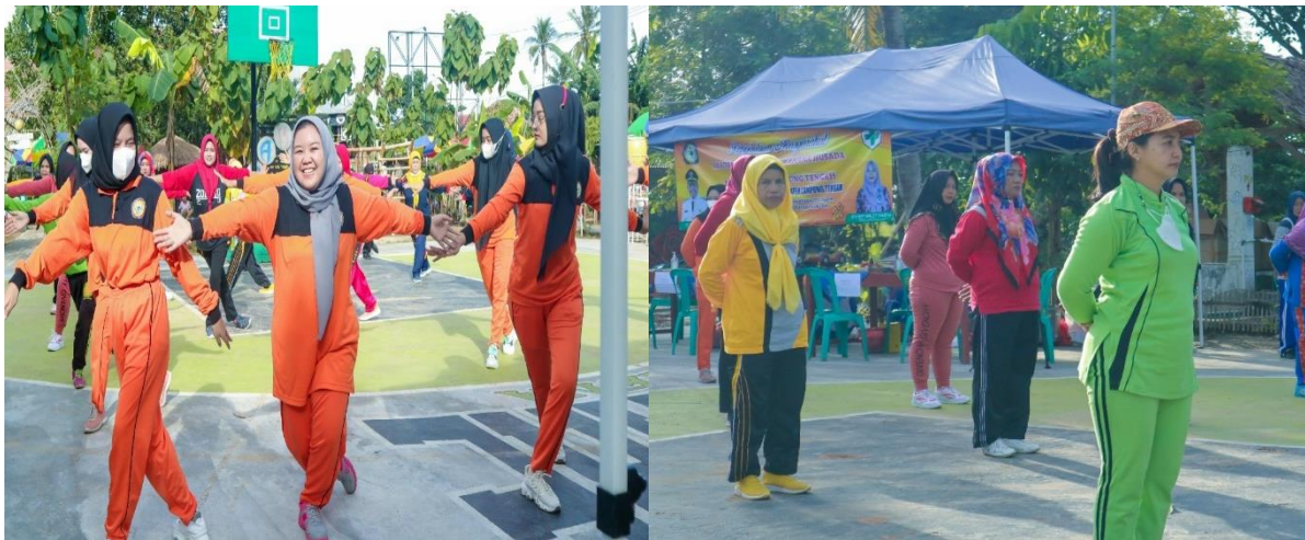
Gambar 4. Pelaksanaan kegiatan senam sehat segar dan ceria di PAKARE.