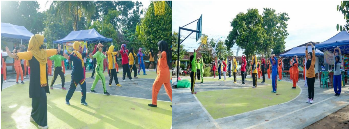
Gambar 3. Pelaksanaan kegiatan senam sehat segar dan ceria di PAKARE.